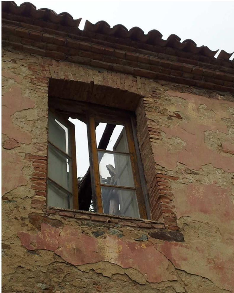
Ex residenza Rettore: Particolari