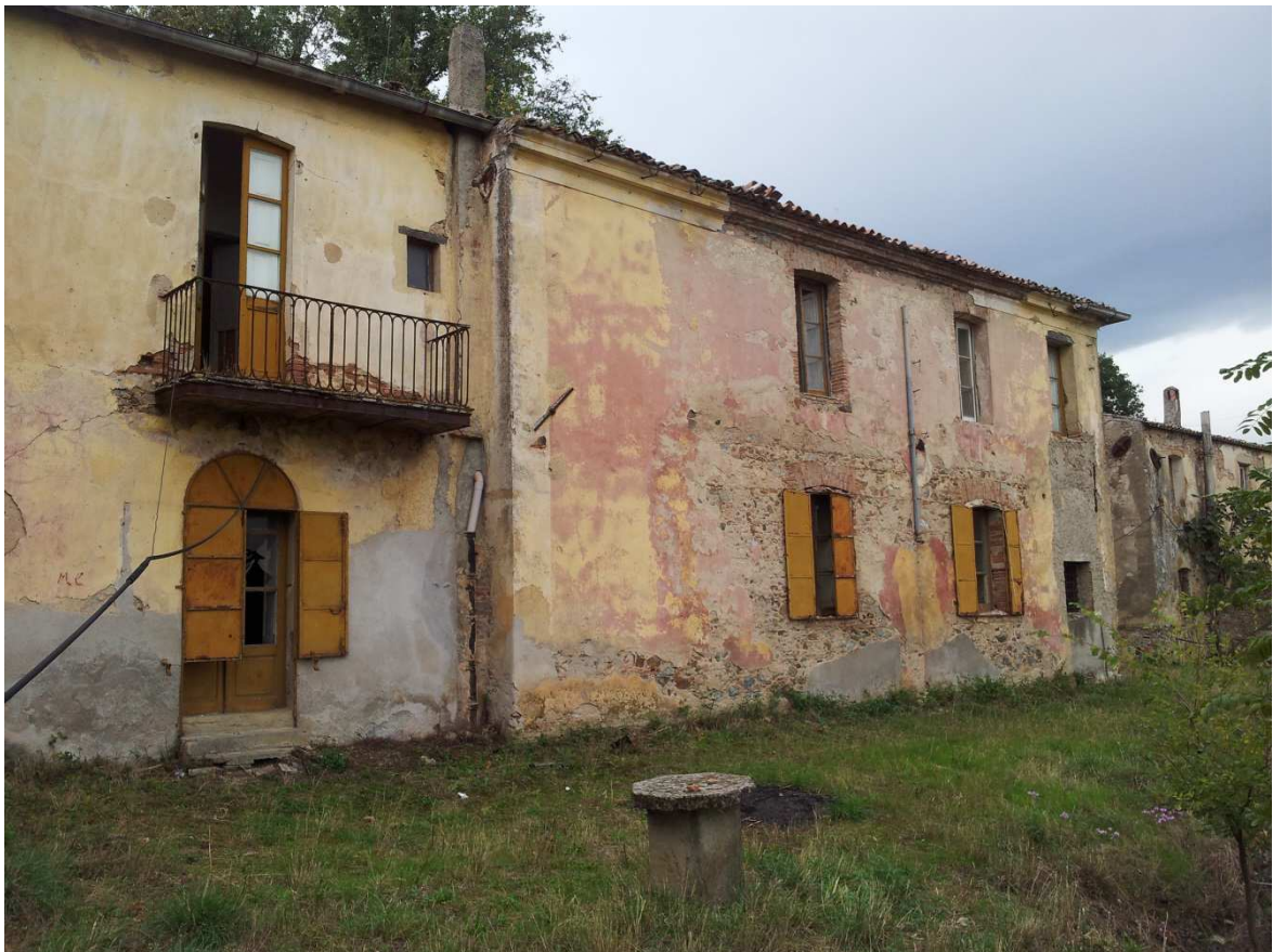
Ex residenza Rettore: Lato Sud