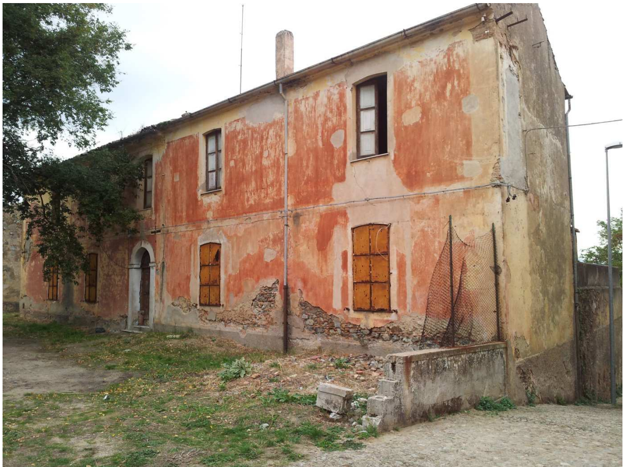
Ex residenza Rettore: Lato Sud (da Via D. Alighieri)