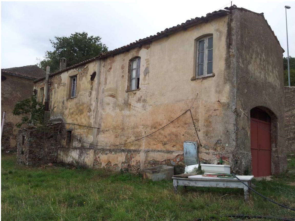
Ex residenza Custode