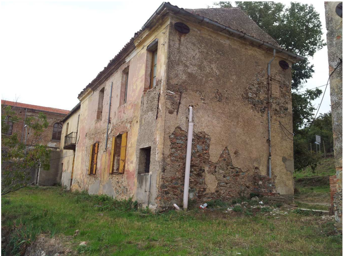
Ex residenza Rettore: Lato Ovest