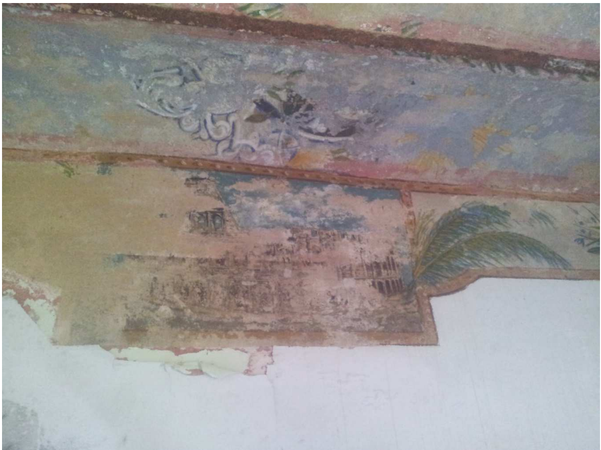
Ex residenza Rettore: Particolare delle pitture di Ndoc Martini all'interno della stanza a PT