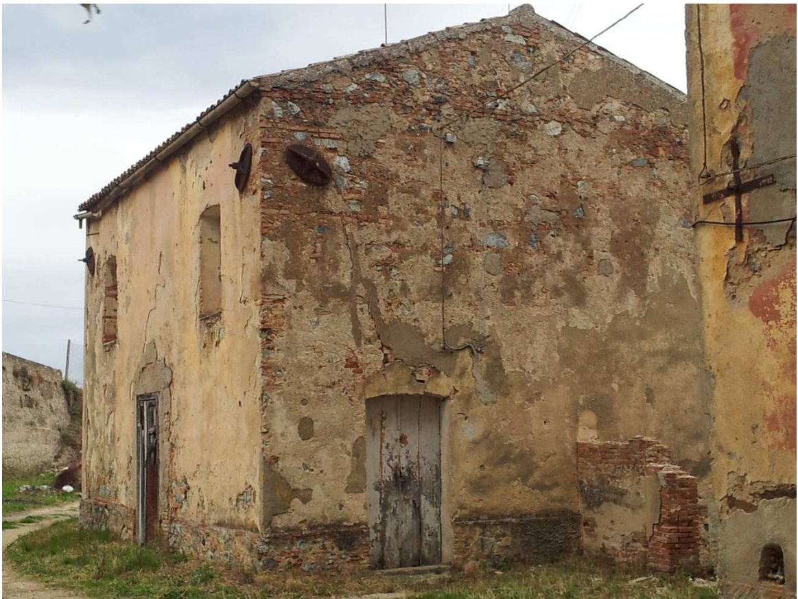
Ex residenza Custode